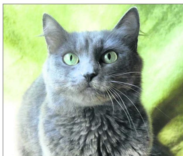
Ähnlichkeiten mit der Russisch Blau sind durchaus vorhanden: Leuchtend grüne Augen in einem silbergetippten schimmernden Fell.